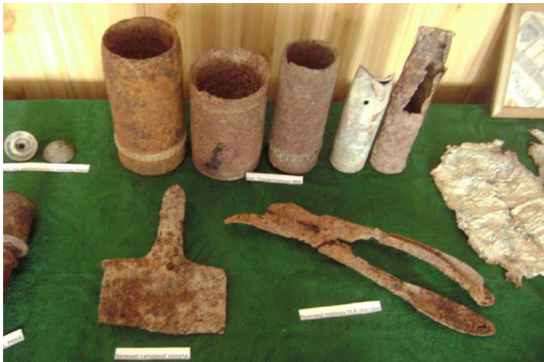
Реліквії Великої Вітчизняної війни