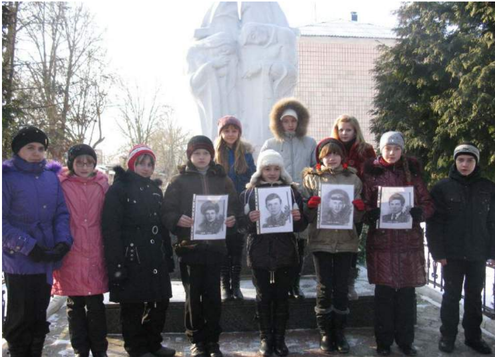
Члени волонтерського загону 7 класу біля пам'ятника воїнам-інтернаціоналістам