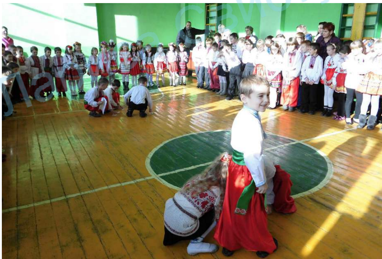
Посвята в козачата учнів 2-х класів