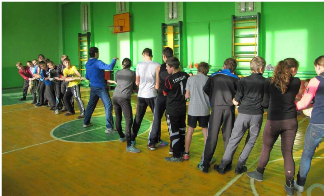
Змагання за програмою «Козацький гарт»