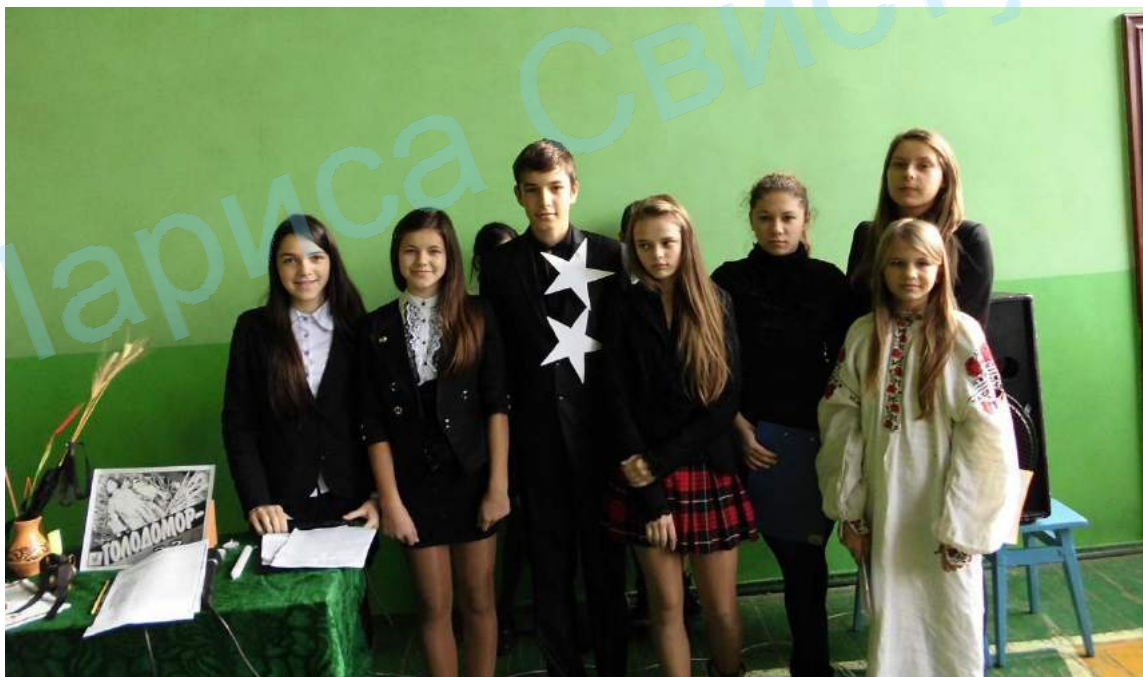
Лінійка Пам'яті «Жертвам Голодомору присвячується»