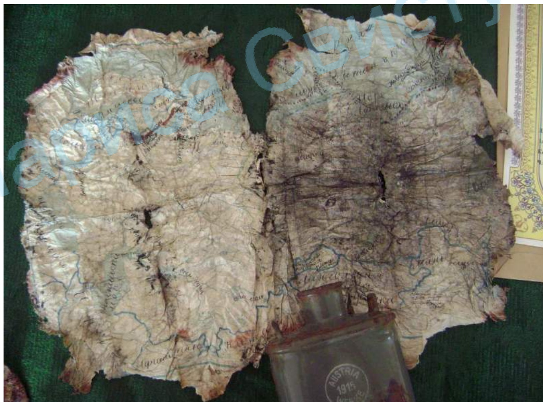
Реліквії Першої Світової війни